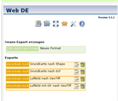
Export mit Web DE