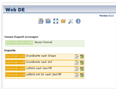
Administration von Web DE