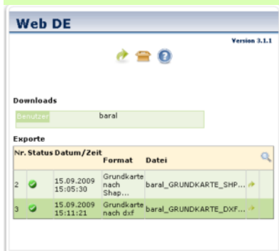
Downloadbereich Web DE